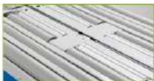
Volitelně také s rolnami!